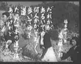
映画「月の輪古墳」