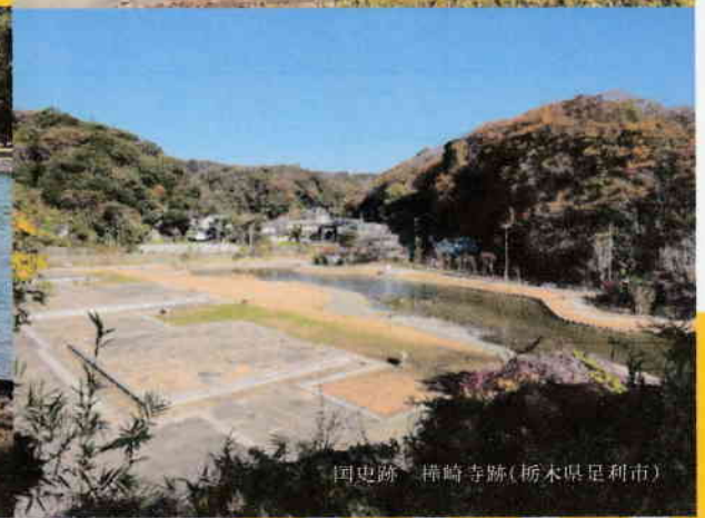
国史跡 樺崎寺跡(栃木県足利市)