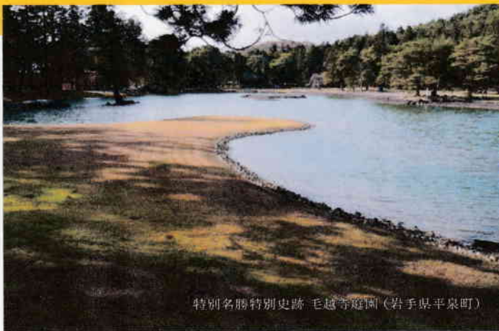
特別名勝特別史跡 毛越寺庭園(岩手県平泉町)