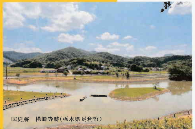
国史跡 樺崎寺跡(栃木県足利市)

次々と明らかになってきた島本町の歴史。一人でも多くの島本町民が、わが町の歴史を知り、遺跡を身近に思い、歴史景観と遺跡の保護と活用を考える機会にしましょう。(講演会内容の要旨)