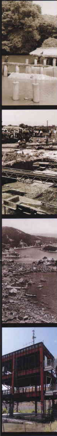
写真(左上から) 月の輪古墳の説明会に参加した生徒たち 復元された朱雀門から復元された第1次大極殿を望む 発掘で姿を現した裏山遺跡 南風原陸軍病院壕群20号