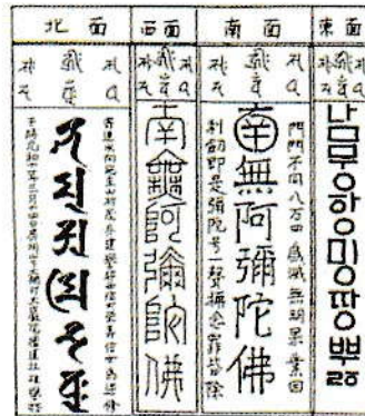
「四面石塔附石製水向」 (千葉県有形指定文化財)

とくにハングルは、15世紀に創生された「東国正韻式」であり、100年ほどの短期間で消滅した字体だという。なぜ17世紀の館山に初期のハングルを刻字した石塔があるのか謎であるが、韓国本土でもきわめて珍しいといわれる。