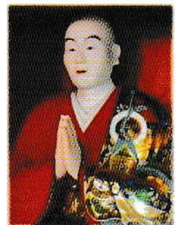
雄誉霊巖上人像（大巖院像）

浄土宗総本山・知恩院（京都市）の第32世となり、3代将軍徳川家光の庇護のもと大火後の再興を果たし、日本一の大鐘を鑄造した。全国に3,000人を超す弟子をもち、熱心な信者に支えられ、各地に多くの寺院を建てた。安房国から伯耆国（鳥取県倉吉）へ改易された里見忠義を訪ねたといわれる。